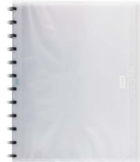
IP over F2E